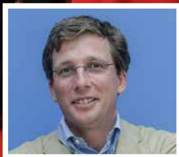
JOSE L. MARTÍNEZ ALMEIDA ALCALDE DE MADRID I FORO DE TURISMO DE MADRID